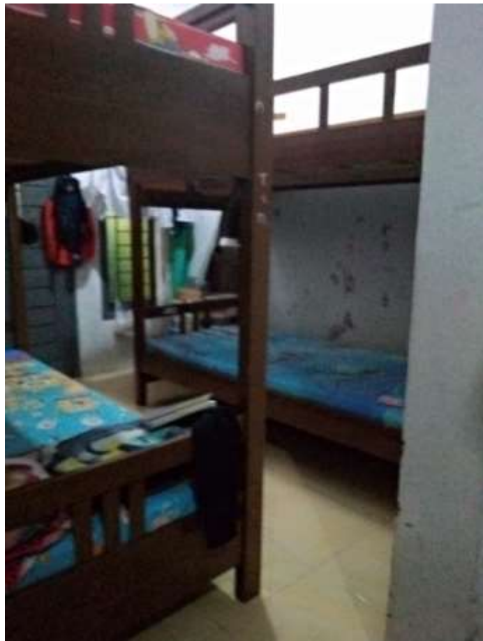
KAMAR DI ASRAMA PUTRI