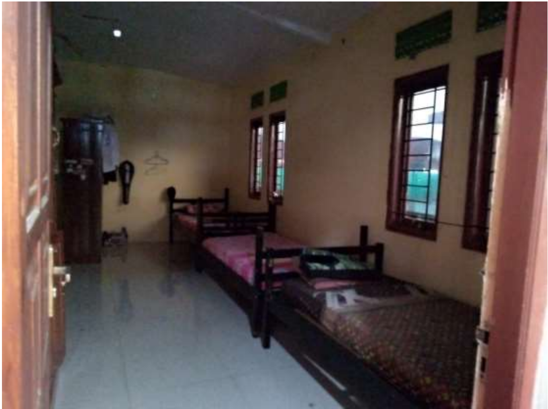
KAMAR DI ASRAMA PUTRA