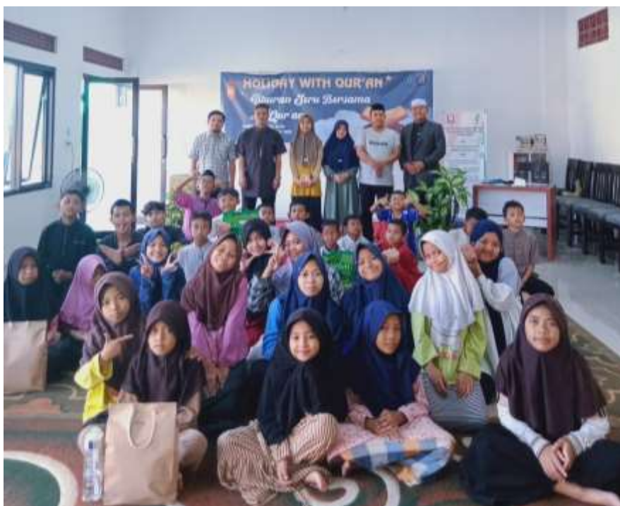
(kegiatan Holiday With Quran, Daurah Tahsin AL Quran)