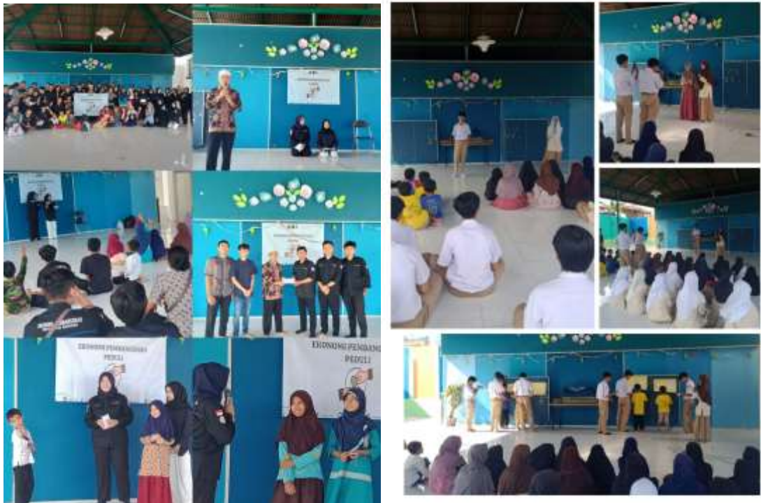
(Kegiatan dan Bukber di Bulan Ramadhan)