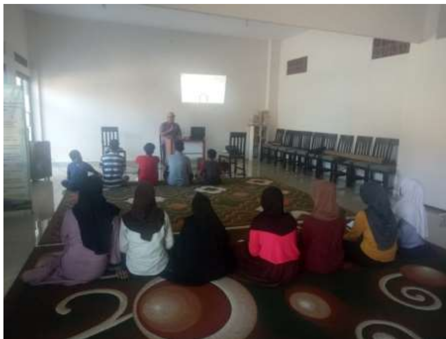
(Pelatihan Dasar Komputer bagi Anak-anak asuh)