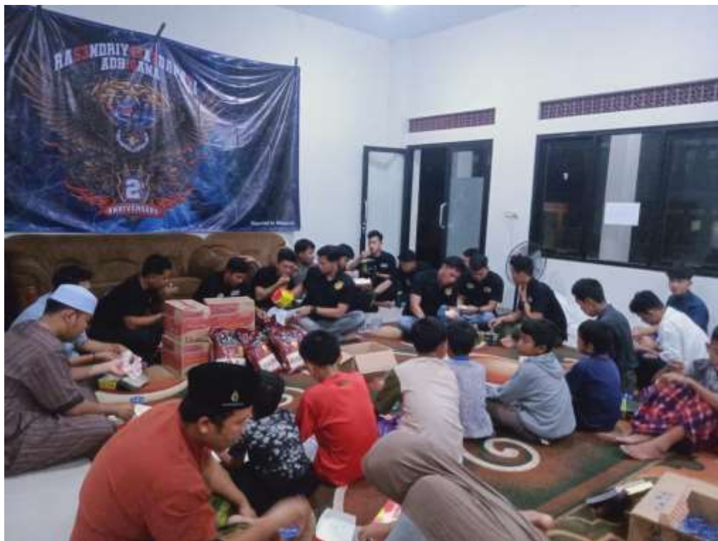
(Kegiatan Doa dan bersama dari Donatur)