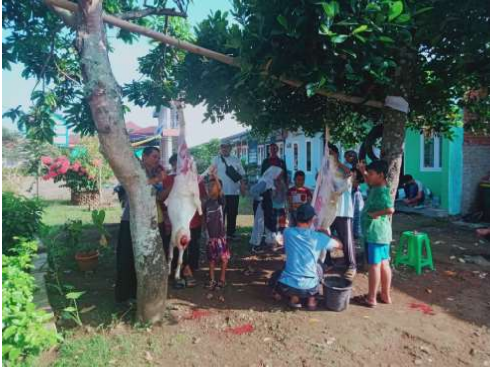
(Kegiatan Penyembelihan Hewan Qurban)