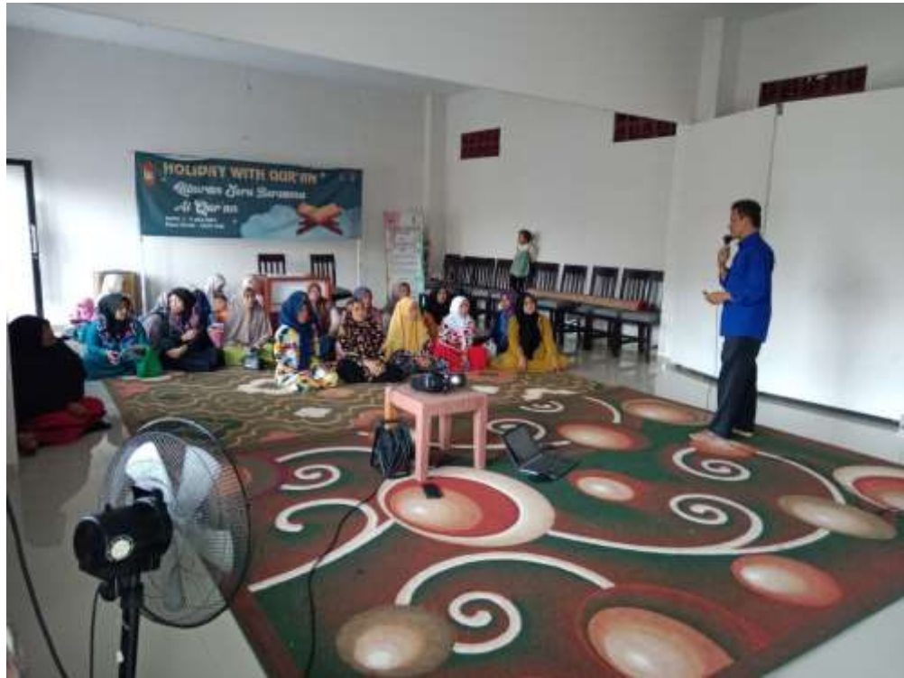
(Kegiatan Pembinaan bagi Orang Tua Anak Asuh Binaan)